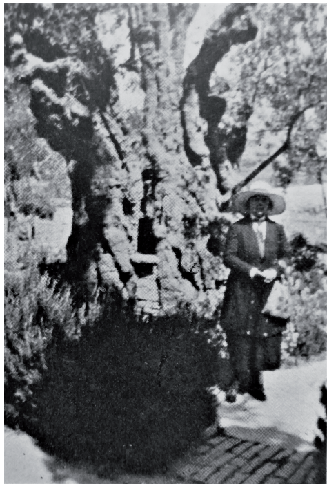
Et af de få billeder fra værket Jorsalafærd, hvor Andrée Carof figurerer omend anonymt, er fra Gethsemane Have. (S. 57)

rafiske jomfru”, og måske er det dette forhold Glyn Jones har i tankerne.