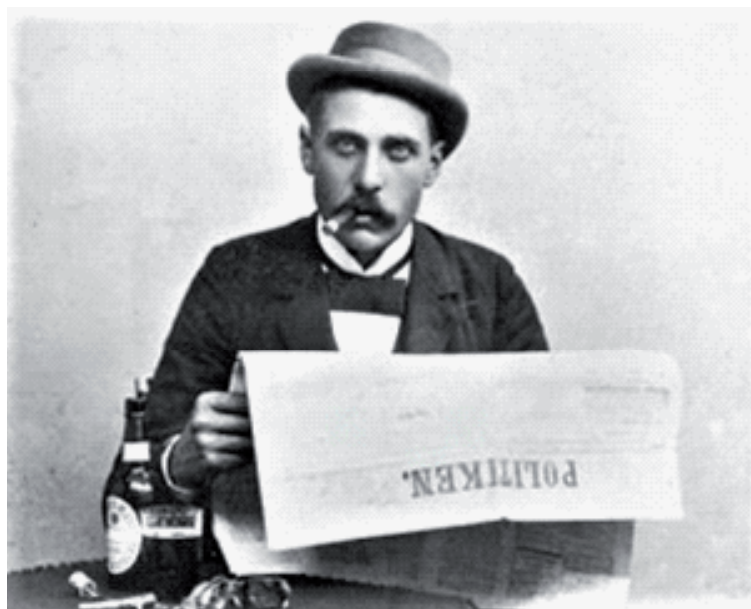
Journalisten Henrik Cavling, senere chefredaktør ved Politiken