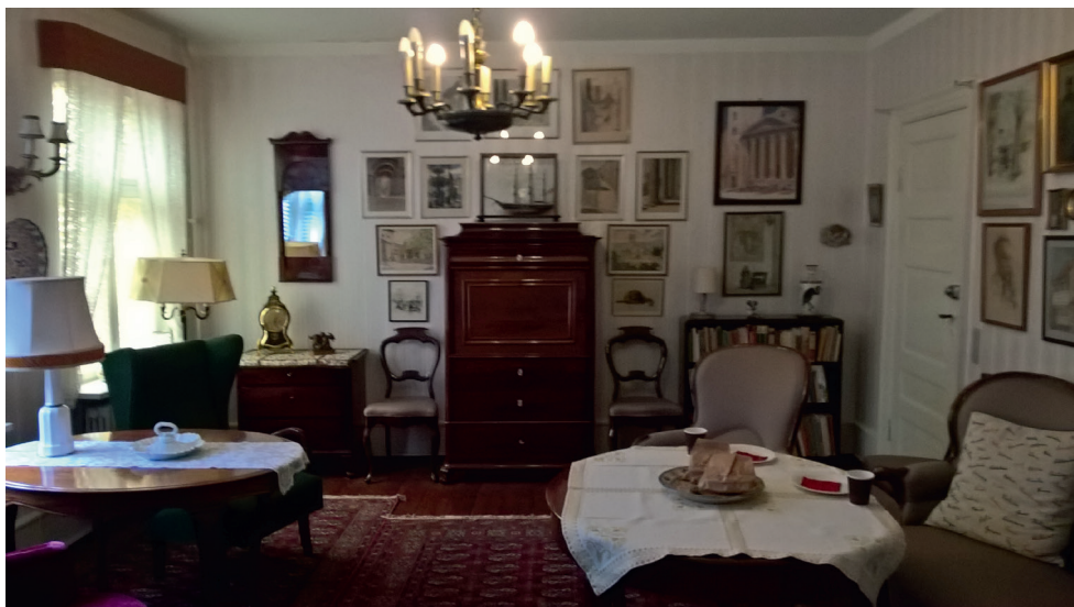
Johannes Jørgensens dagligstue på førstesalen i huset i Fruestræde står som han forlod den med billeder, der illustrerer hans liv i både Danmark og Italien.

især i de yngres bevidsthed, fremstod behovet for en nytænkning for at genetablere og måske endda genoplive interessen for hans litterære værk. Det var jo dog det, som han var blevet verdensberømt for. Ønsket var, at stedet ikke blot skulle holde minderne i live, men også interessen for hans person og litterære værk. Derfor besluttede man på et tidspunkt at omdøbe huset til "Johannes Jørgensens Hus" i et forsøg på at luften støvet ud og bringe en ny og mere befordrende og spændende virksomhed ind – med andre ord forsøge at gøre huset til et egentligt museum for en af vores største digtere med skiftende (og permanente) udstillinger til belysning af hans liv og virke.