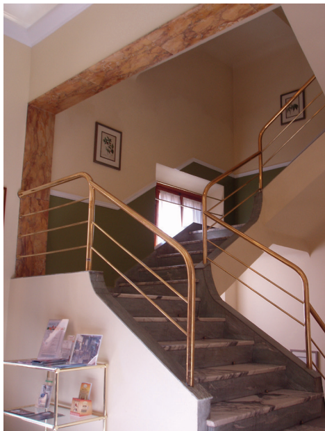
Pensionens hovedtrappe spiller en vigtig rolle i Jørgensens dagbogsnotater fra tiden i Pensione Chiusarelli. Også den har siden gennemgået en modernisering.

Ballins død ham. Det påførte ham et hårdt slag, som han forsøgte at bearbejde ved at ville skrive en bog om vennen, men det blev ved forsøget.