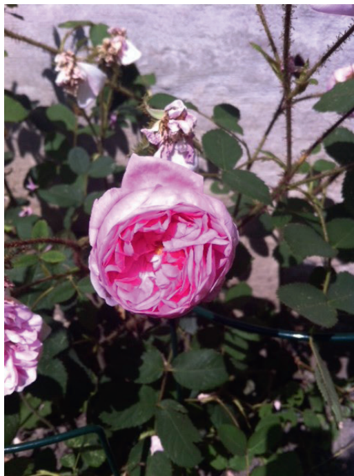
Museets samlinger strækker sig også ud i haven bag huset. Dette billede viser mosrosen, som Jørgensen viede et digt i samlingen "Der er en Brønd, som rinder".

Besøgstallet har været stigende gennem de sidste år, og især den megen opmærksomhed, Johannes Jørgensen var genstand for i 2016 som "Årets Klassiker" ved avisartikler, arrangementer og med bogudgivelse, har betydet øget interesse og mange besøgende i Johannes Jørgensens Hus.