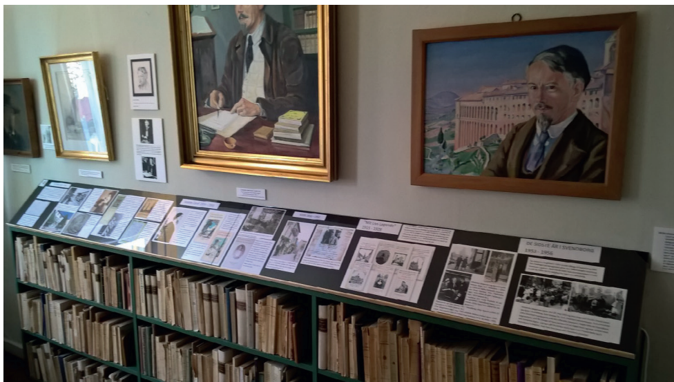
I en 13 m. lang "livsline" berettes der i ord og billeder om Johannes Jørgensens lange liv, hans venner og bekendtskaber og litterære værk.

Det tætte samarbejde, som siden 2002 har været mellem Johannes Jørgensens Hus ved Svendborg Bibliotek og Johannes Jørgensen Selskabet har bevirket, at nye udstillingsprincipper i forlængelse af husets oprindelige status som et minde over