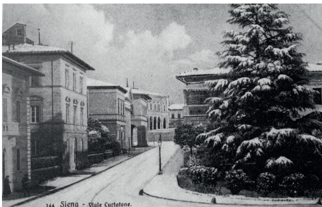
Gammelt prospektkort, der viser Viale Curtatone i Siena med Pensione Chiusarelli til venstre på den tid, da Johannes Jørgensen boede her.

– "(Dagb. 310. 8. okt. 1917) – hvorefter han opremser flere – især kvinder – som her har efterladt sig vemodige spor i hans erindring.