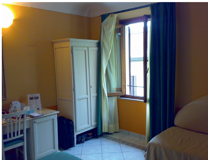
Værelset, Johannes Jørgensen beboede i de to år i Siena, har stadig nr. 23 og kaldes "Danskeværelset" af stedets nuv. Ejere, men har i løbet af de 100 år gennemgået en naturlig modernisering.