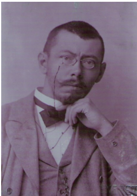
Den unge Johannes Jørgensen

Det er i år 150 år siden, Johannes Jørgensen blev født. I den anledning har Johannes Jørgensen Selskabet lavet en flot antologi om den fynske kosmopolit. Jørgensen har i de senere år oplevet lidt af en revival med en række bøger og forskningsartikler om ham.