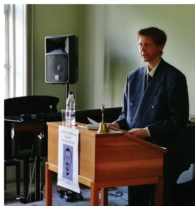
Jon Gissel