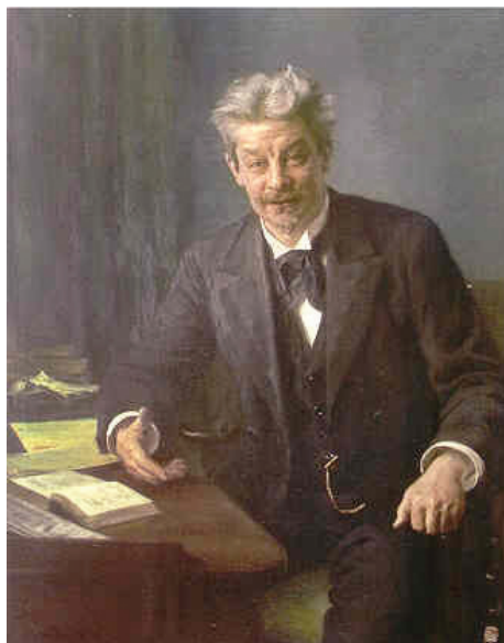
Georg Brandes. (Maleri af P.S.Krøyer. 1900)

symbolistiske digtere og den senere læsning af decideret katolske skribenter skulle komme til at præge hans åndelige udvikling, og som han senere gentagne gange skulle komme til at vende tilbage til; nemlig "den tyske Pessimist" (Jørgensen 1915, II: 167), filosofen Arthur Schopenhauer 1 . Denne artikel handler om Johannes Jørgensens forhold til denne