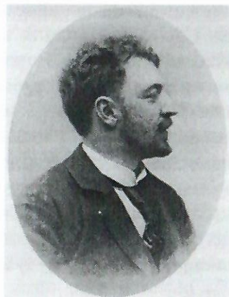
Den unge Sophus Claussen